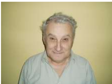
Pan Ringer Jan

Do nového roku přeji všem klientům hodně zdraví a štěstí v osobním životě.